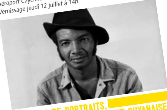
Aéroport Cayenne - Félix Eboué Vernissage jeudi 12 juillet à 14h.

Alchimie est une galerie de portraits définis par un nom d'élément chimique associé à son nombre atomique. Chaque portrait possède ainsi sa propre identité et se laisse regarder. L'ensemble s'accompagne d'une vidéo, d'une musique, et de textes de poésie. Ils soutiennent les visuels présentés comme autant de paysages humains, pièces d'un puzzle unique. Les photographies de Mirtho Linguet interrogent ainsi l'individu dans son rôle dans la société en tant que facteur de richesse culturelle.