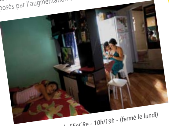
Salle d'exposition de l'EnCre - 10h/19h - (fermé le lundi) Vernissage le mercredi 11 juillet à 19h.

Le photojournaliste John Stanmeyer montre à travers cette série comment l'émancipation des femmes et les stéréotypes véhiculés par les telenovelas brésiliennes ont fait chuter le taux de natalité et dynamisé l'économie du Brésil. Ce travail du photographe de l'agence VII, a été produit et publié par National Geographic dans le cadre de la série « 7 milliards », une enquête sur les challenges posés par l'augmentation de la population mondiale.