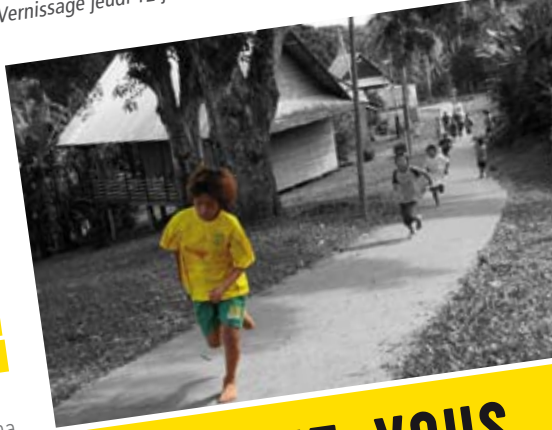
Musée Alexandre Franconie Vernissage jeudi 12 juillet à 17h30

Depuis février 2010, l'association AMECAM, le collège de Camopi, le Musée des cultures guyanaises et le Parc amazonien de Guyane collaborent autour du média Photo. Ce partenariat a permis la mise en place d'un atelier associatif à Camopi et la réalisation d'une « classe patrimoniale » à Cayenne en avril 2011, dédiés à des élèves de 3 ème et aux membres de l'atelier. L'exposition résulte de ce travail collectif.