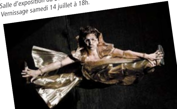
Salle d'exposition du Bar des Palmistes 10h/19h (fermé Lundi) Vernissage samedi 14 juillet à 18h.

La revue Zmâla, l'oeil curieux nous propose un panorama contemporain d'une photographie créative, indépendante et courageuse qui témoigne des bruits du monde. Zmâla est une revue consacrée à la production des collectifs de photographes, en France et dans le monde. La revue nous donne ici un aperçu de cette grande famille, de cette " smala " - une trentaine de collectifs rassemblant quelques 200 photographes dans plus de 15 pays - au travers d'une exposition mettant en scène cinq reportages, cinq photographes, cinq regards.